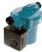
Bomba de Circulación